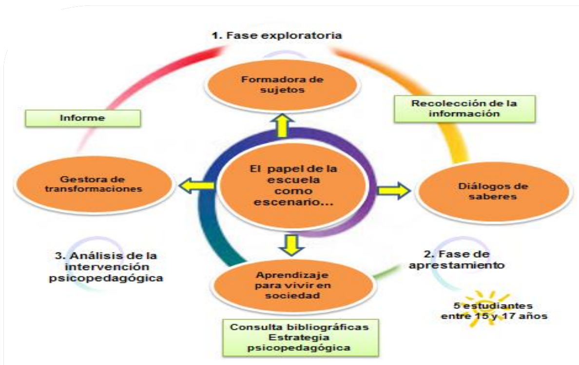
Figura 1. Fases de la investigación