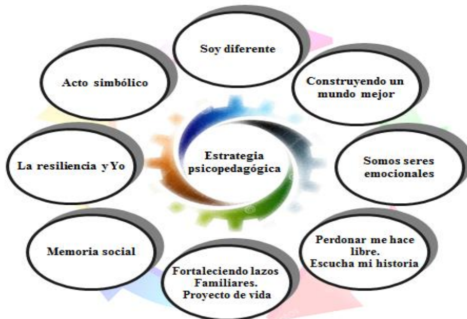
Figura 3. Organización de temas a tratar en las citas